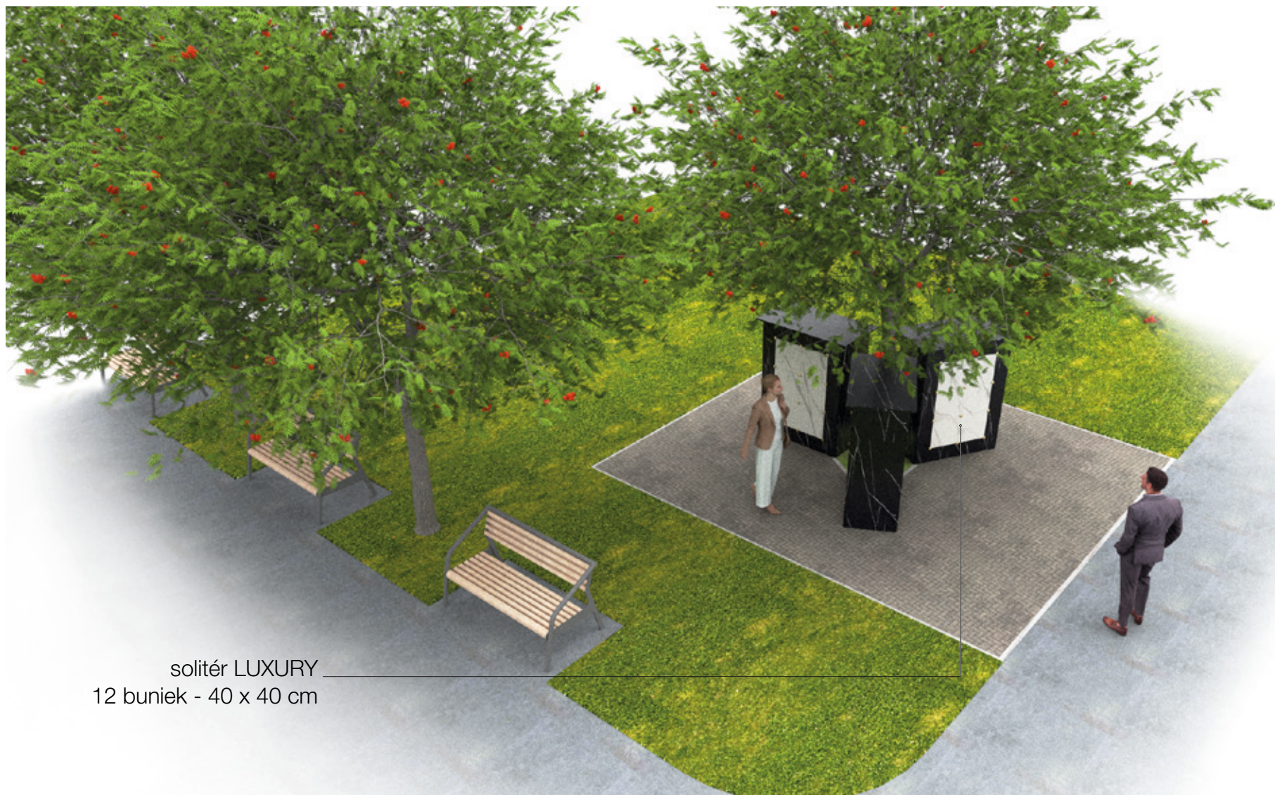
solitér LUXURY 12 buniek - 40 x 40 cm