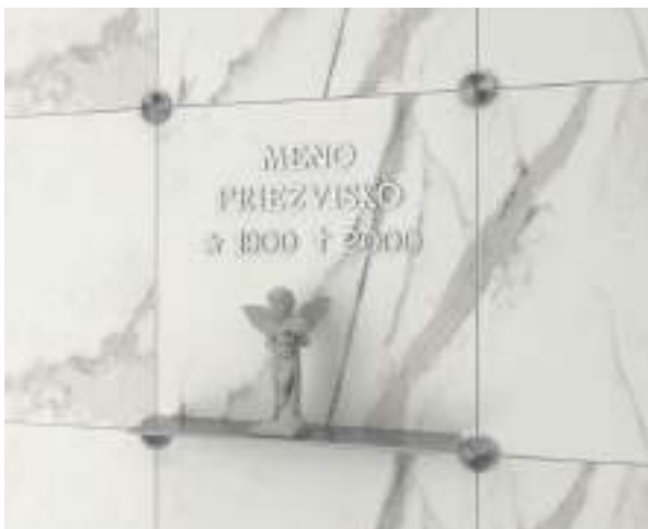
nápisná doska 40 x 40 cm bez doplnkov