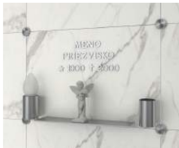
nápisná doska 60 x 40 cm s doplnkami

Všetky doplnky (lampáš, váza, písmo a polička) sú lepené vysokopevnostnou VHB páskou, s ktorou máme dlhoročné skúsenosti. Anjel na obrázku je len ilustračný, nie je súčasťou dodávky.