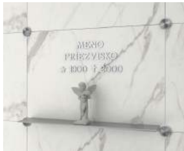
nápisná doska 60 x 40 cm bez doplnkov