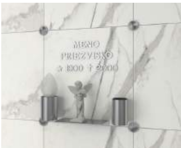
nápisná doska 40 x 40 cm s doplnkami