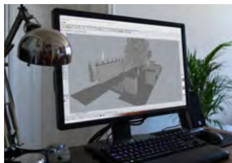
architektonický návrh prostoru