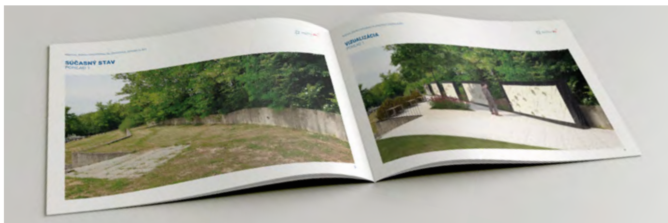
komplexní dokument s návrhem prostoru