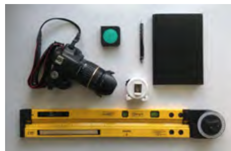
profesionální zaměření prostoru