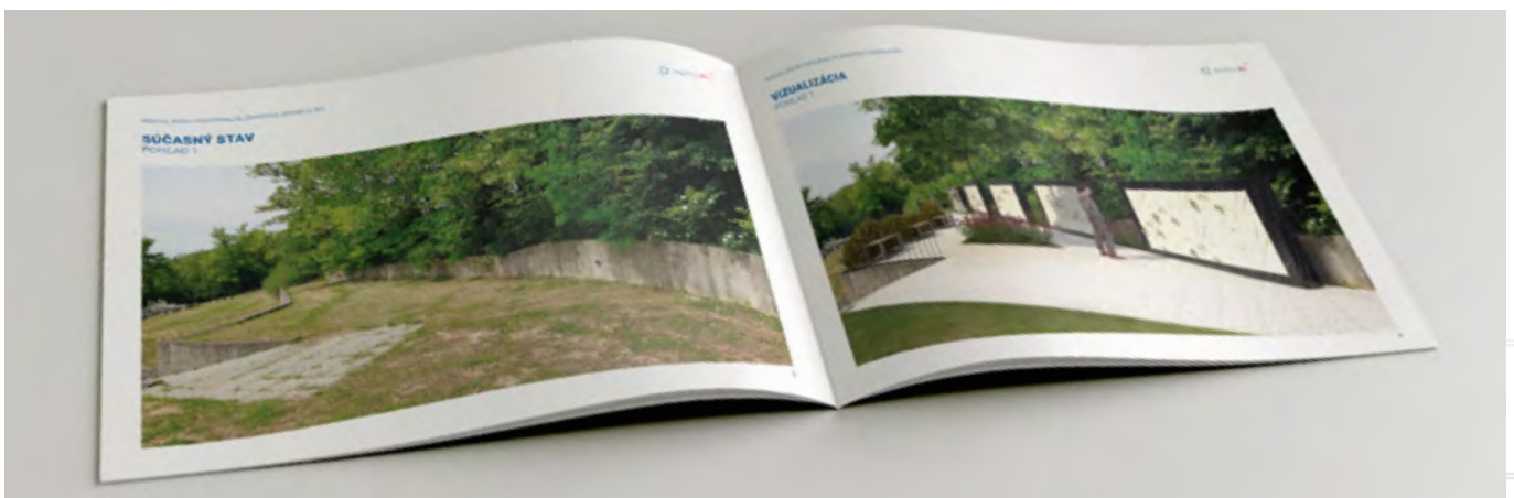
komplexný dokument s návrhom priestoru