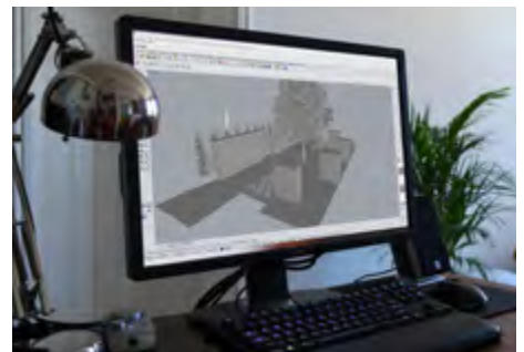
architektonický návrh priestoru